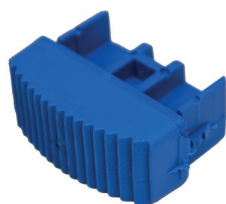
108260ST | 108270ST